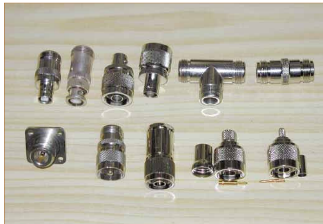
FIGURA NÚMERO UNO: CONECTORES TIPO "N".