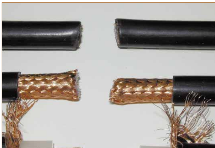
FIGURA NÚMERO DOS: CUBIERTA RETIRADA.