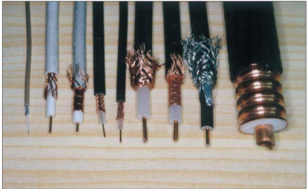
FIGURA NÚMERO UNO: CABLES COAXIALES.

El conductor interior puede ser de un solo hilo macizo o bien estar formado por varios hilos retorcidos. El conductor exterior puede estar formado por una o dos mallas y además puede llevar una lámina de aluminio o cobre, con lo que el blindaje mejora. Entre los dos conductores se encuentra un aislante, que puede ser macizo, normalmente de polietileno, o bien formado por una espuma plástica. En este caso el cable es algo más flexible.