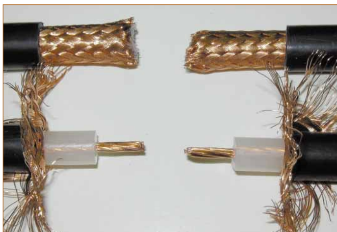
FIGURA NÚMERO TRES: AISLANTE CENTRAL RETIRADO.