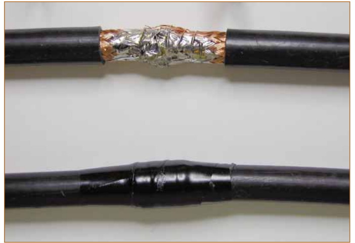
FIGURA NÚMERO SEIS: SOLDADO DE MALLAS. ENCINTADO.

mitades alrededor de la soldadura y las sujetaremos con una gota de loctite, tal como se puede ver en la figura número cinco. De esta manera conservamos el diámetro del conductor central con su aislante.