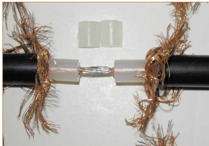
FIGURA NÚMERO CUATRO: CONDUCTORES CENTRALES SOLDADOS.