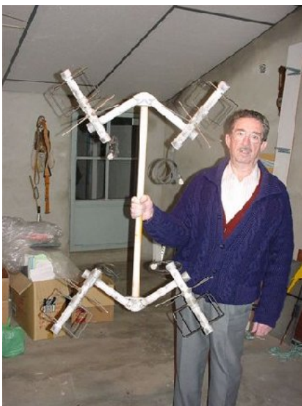
e) 4*TPM2 en la mano

De esta manera he estado trabajando 2 años con cientos de contactos en los satélites UO14, AO27 y SO35.