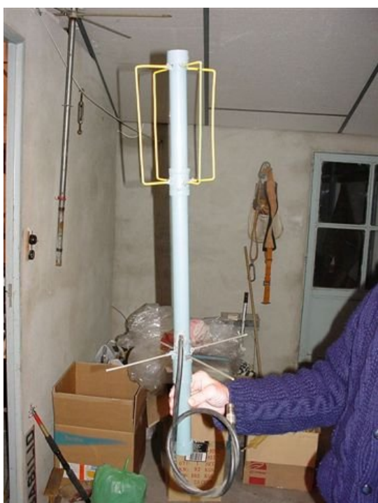
c) Eggbeater II de UHF

Aún así la antena me gustaba, pues la verdad es bonita, e hice una versión para VHF, y poder subir a los pajaritos. En VHF es una verdadera bomba, y no solo subiendo, sino la utilicé también para recibir los satélites meteorológicos, obteniendo resultados mucho mejor a los de la Turnstyle, sobre todo en ángulos bajos. Os puedo contar que como tiene polarización horizontal en el horizonte, posteriormente he trabajado estaciones en SSB terrestres a mas de 400 Km. sin estar estas en una sierra. Esta antena si me dio muchas satisfacciones.