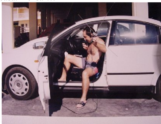
b) EA4CYQ en acción