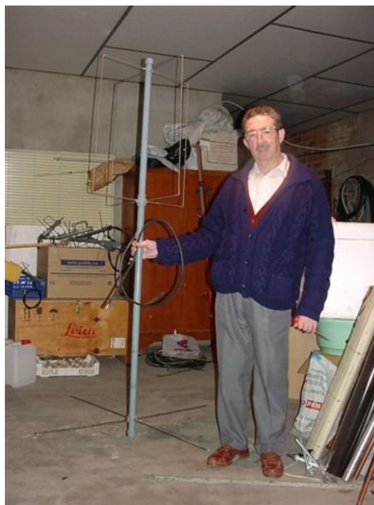
d) Eggbeater II de VHF + EA4ABV