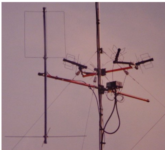
f) Eggbeater de VHF + 4*TPM2 de UHF