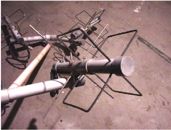
g) TPM2 de UHF