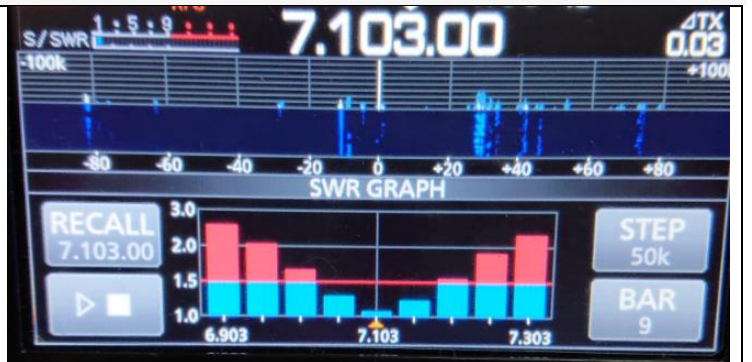
73 Carlos EC1T